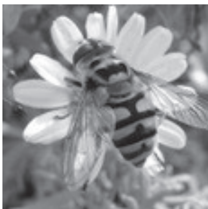
Foto 1 Blinde bij / foto 2 bladluis etende larve / foto 3 doodshoofdzwever / foto 4 Gele fophommel